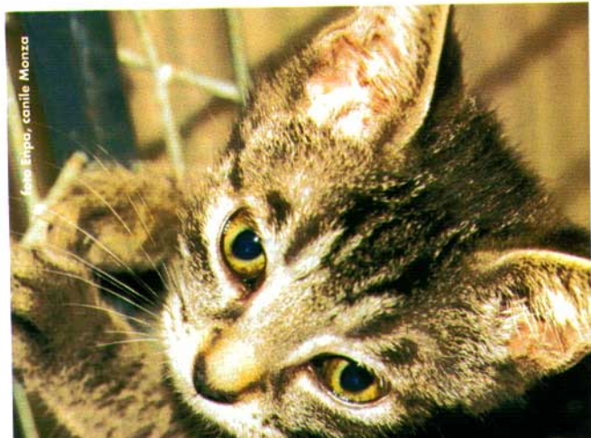
canile Monza

Le denunce fioccano. Solo negli ultimi mesi, sono decine i canili posti sotto sequestro dalle forze dell'ordine. Come quello a Mazzano Romano, dove la Guardia Forestale ha trovato cani denutriti e ha diagnosticato ad alcuni ospiti artrosi, cheratiti, otiti. "Pessime le condizioni igieniche delle gabbie", hanno riferito i Forestali, con deiezioni sparse sul pavimento, cannaletti di scarico intasati, cucce troppo piccole e detenzione "non coerente alle caratteristiche etologiche della specie". Co-