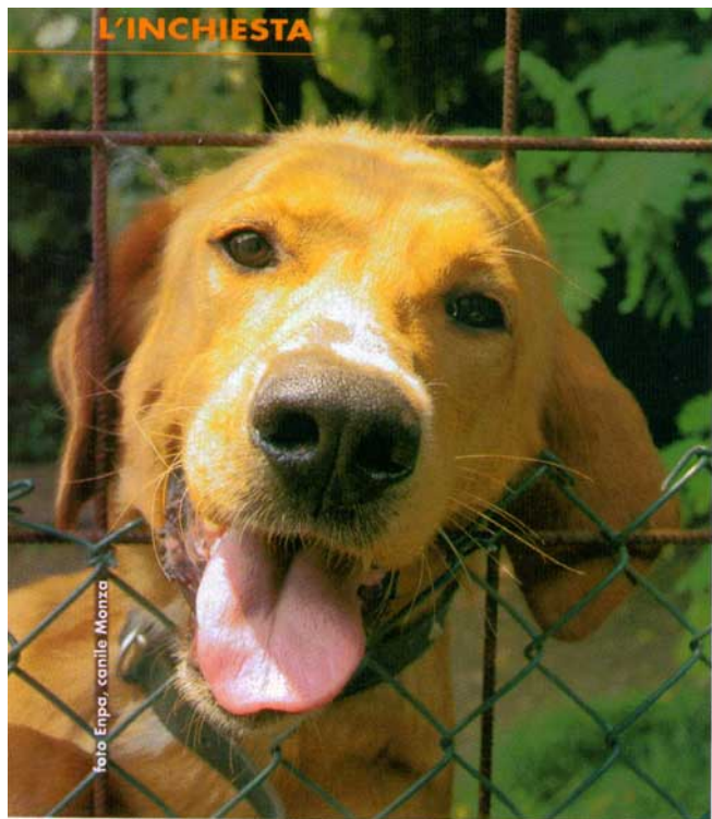
canile Monza

me quello di San Giorgio Jonico , in provincia di Taranto, un canile da tempo nel mirino delle associazioni animaliste, dove i Carabinieri hanno trovato 363 randagi rispetto ai 60 previsti. Come a Taranto, città che ha "accumulato" l'incredibile numero di 2.000 cani in tre strutture diverse e nelle quali non è consentito l'accesso ai volontari. Ora, dopo la dichiarazione di dissesto finanziario del Comune, è stata chiesta la revoca degli appalti milionari stipulati coi canili convenzionati. Tra i più "gettonati" dalle denunce delle associazioni protezionistiche vi è il canile privato Oasi San Leo , sito sulle montagne di Cicerale del Cilento , che vanta appalti con le Asl del salernitano e con quasi 100 Comuni. "Circa 2.000 animali sono stipati in recinti più o meno grandi, completamente abbandonati a loro stessi, coperti di parassiti, annientati dalle malattie", accusano le associazioni Una e Oipa. Lo stesso ingresso in canile sarebbe osteggiato dal proprietario e dall'unico operaio in servizio. "Il cancello della struttura non viene aperto neanche di fronte a proprietari che vengono a reclamare un proprio cane di famiglia, catturato per errore. Le norme indicate dalle leggi vengono regolarmente disattese: mancano le aree contumaciali che dovrebbero ospitare gli animali malati, maschi sono mischiati nei branchi con femmine non steri-