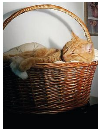
Jj, il gatto sparito da Stiolo