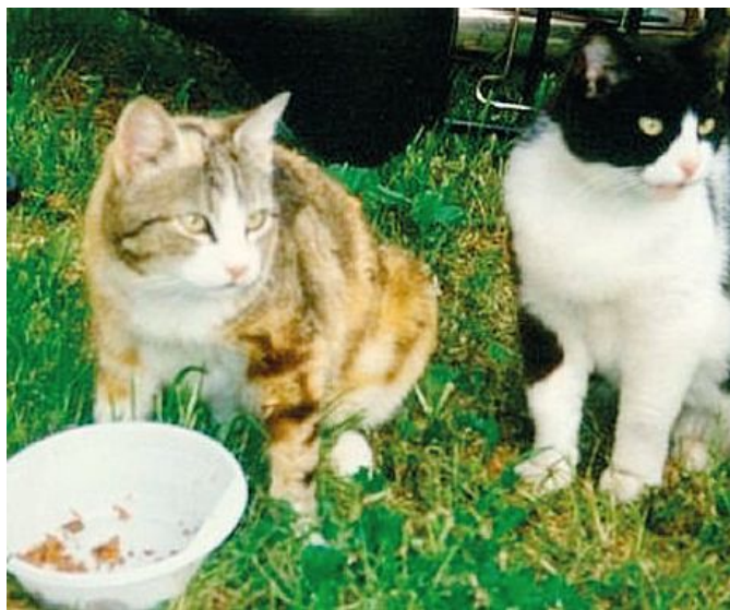
L'esperienza sui comportamenti felini fa temere il peggio sul fenomeno

Quando si parla di gatti, è sempre complicato almeno inizialmente riuscire capire se non si tratti soltanto di animali purtroppo finiti investiti. Ma da Lac e Aper dicono: «A fronte dell'esperienza raccolta in oltre dieci anni di attività, riferita alle nozioni comportamentali dei piccoli felini e, soprattutto, a fronte del numero considerevole di animali adulti scomparsi senza lasciare traccia, siamo certi che gli animali non si siano allontanati di loro iniziativa. Veleno, armi, trappole: questi sono i